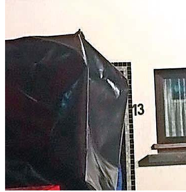
Kaminbrände wie in Freisen kommen im Kreis St. Wendel häufiger vor.

schlüssen, Rissen am Kamin, an der Kaminwanne anliegenden brennbaren Bauteilen.