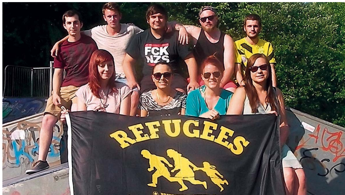
Das Orga-Team des Volcano-Festivals hat bis Samstag noch alle Hände voll zu tun.