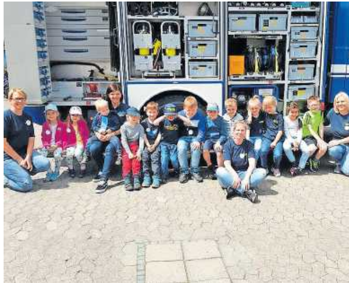
Gruppenfoto der Minis mit ihren Betreuerinnen.