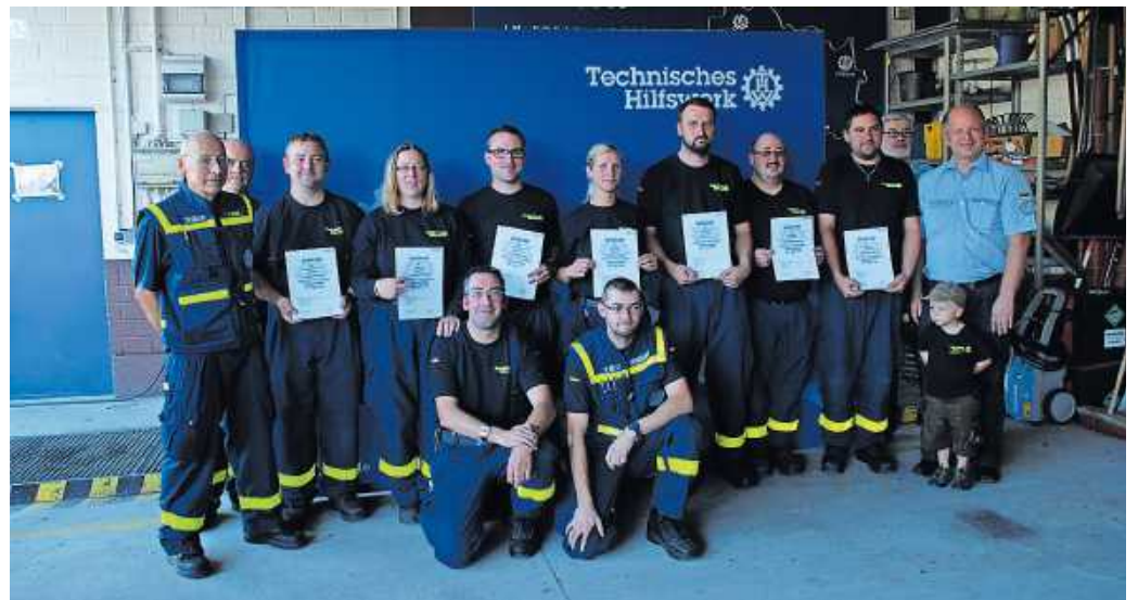
Die sieben Prüflinge des THW-Ortsverband Freisen.